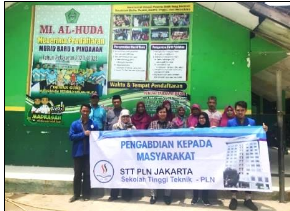
Gambar 6. Foto Bersama Tim PKM IT-PLN dan Mitra

Setelah dilakukan kegiatan edukasi, peningkatan pemahaman siswa-siswi akan sanitasi dan kebersihan dapat diketahui dari hasil post-test yang nilainya mengalami kenaikan jika dibandingkan dengan hasil pre-test . Kegiatan edukasi diikuti oleh 63 siswa, , sebelum edukasi nilai rata-rata adalah 2,5 dan setelah edukasi nilai rata-rata 6,5 sehingga terjadi peningkatan sebesar 38,46%. Hasil nilai tes sebelum dan sesudah edukasi terdapat pada Tabel 1 dan Gambar 7. Kesimpulan kegiatan ini adalah bahwa MI Al Huda Bekasi telah memahami mengenai sanitasi sekolah serta menjaga kebersihan diri dan lingkungan.