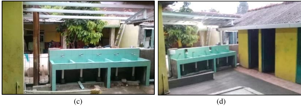
Gambar 3. Tahapan Pekerjaan Sarana Akses Cuci Tangan (a) Pengecoran (b) Pemasangan Keramik (c) Pemasangan Atap dan Talang (d) Hasil Akhir

Sarana akses cuci tangan yang dibangun terletak di depan toilet siswa dan guru di samping gedung ruang guru dan kepala sekolah serta berhadapan dengan jalan dan perumahan warga. Wastafel tersebut dibangun berukuran 250cm x 50cm x 70cm disesuaikan dengan kondisi lokasi serta tinggi badan siswa-siswi Madrasah Ibtidaiyah Al Huda. Wastafel dilengkapi dengan 5 buah keran air dan saluran buangan air menuju ke luar sekolah. Karena posisi wastafel berada di luar bangunan sekolah, maka pada bagian atas wastafel diberi atap serta dilakukan pembuatan saluran, penambahan talang air, dan perbaikan lantai. Pada pengerjaan pembangunan wastafel, tim Pengabdian Kepada Masyarakat dibantu oleh beberapa tenaga kerja hingga pekerjaan selesai pada Bulan Februari 2020.