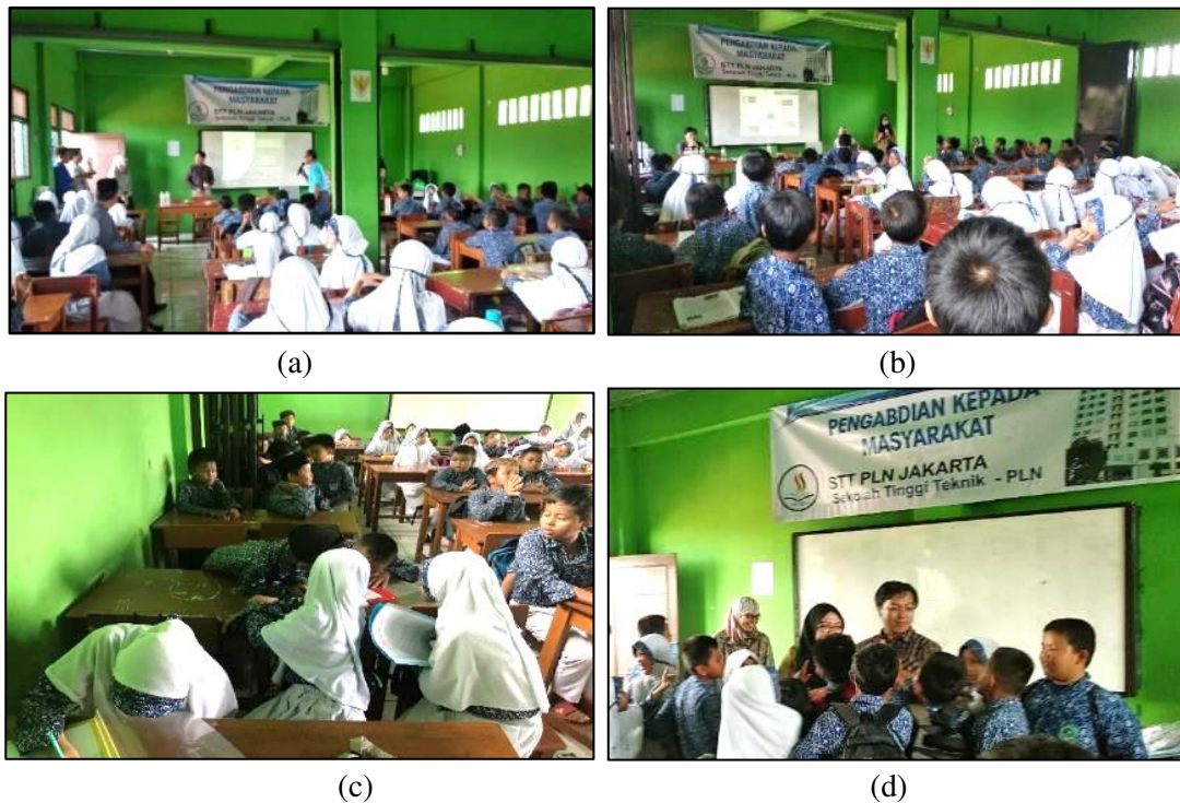
Gambar 5. Suasana Kegiatan Edukasi PKM (a) Sambutan Perwakilan Sekolah dan Ketua Tim (b) Pemaparan Materi (c) Pre-Test dan Post-Test (d) Antusias Siswa Sesi Tanya Jawab

Kegiatan edukasi diawali dengan sambutan dari perwakilan Kepala Sekolah Madrasah Ibtidaiyah Al Huda Bekasi, sambutan ketua tim dan dilanjutkan dengan pemberian pre-test untuk mengukur pengetahuan peserta akan kebersihan dan sanitasi sekolah. Kegiatan selanjutnya adalah pemaparan materi mengenai sanitasi sekolah dan menjaga kebersihan melalui pembiasaan perilaku bersih, mencuci tangan dengan sabun, serta memilah sampah sesuai jenis sampah organik dan anorganik sebelum dibuang [3] . Setelah pemaparan materi, dilanjutkan sesi tanya jawab terhadap peserta dan pemberian post-test untuk mengetahui pemahaman siswa setelah diberikan edukasi. Kegiatan berlangsung dengan lancar dan cukup meriah, terlihat dari antusias peserta dalam mengikuti tutorial cara cuci tangan yang benar dan keaktifan peserta dalam menjawab pertanyaan-pertanyaan dari pemateri tim PKM IT-PLN. Suasana kegiatan edukasi serta tim PKM dan mitra terdapat Gambar 5 dan 6.