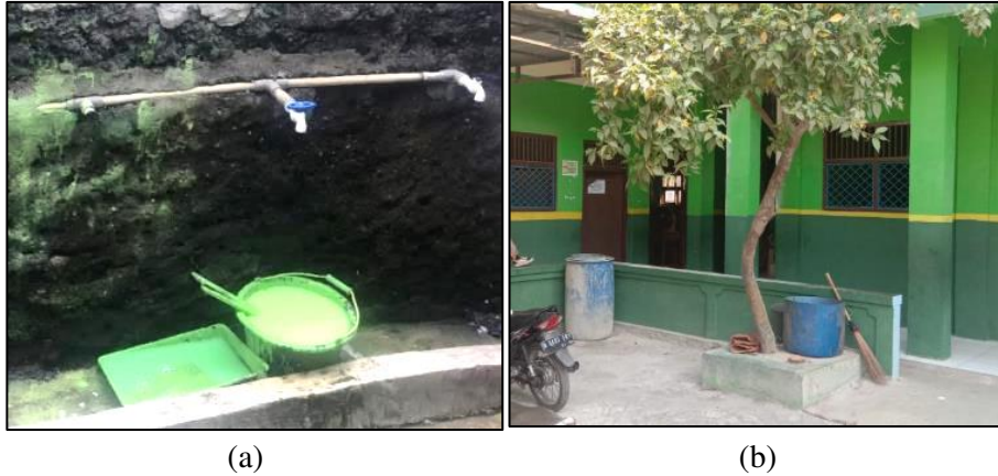
Gambar 1. Sanitasi Sekolah yang Tidak Memadai (a) Sarana Akses Cuci Tangan (b) Tempat Sampah

Hal ini perlu segera diatasi dengan meningkatkan sanitasi sekolah. Selain itu perlu diberikan edukasi kepada para siswa dan guru tentang pentingnya sanitasi sekolah dan menjaga kebersihan. Setelah diadakannya kegiatan PKM, diharapkan Sekolah Madrasah Ibtidaiyah Al Huda Bekasi sebagai mitra dapat: