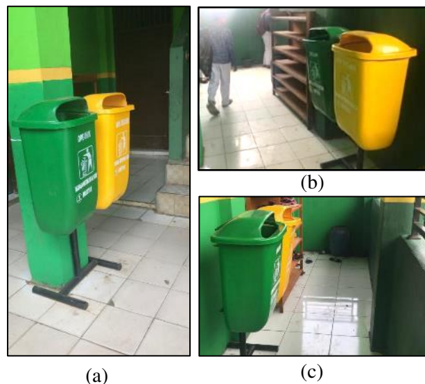
Gambar 4. Tempat Sampah Organik Anorganik (a) Posisi Dekat Tangga (b) Posisi Lantai 2 Gedung 1 (c) Posisi Lantai 2 Gedung 2

Peningkatan sarana sanitasi sekolah di Madrasah Ibtidaiyah Al Huda tidak hanya melalui pembangunan sarana akses cuci tangan saja, tetapi juga dengan cara menempatkan tempat sampah terpisah jenis sampah organik dan anorganik yang dapat memudahkan pengangkutan dan pengolahan sampah. Penyediaan tempat sampah dilakukan dengan menganalisis jumlah kebutuhan dan lokasi penempatan, kemudian menyiapkan tempat sampah beserta dudukannya dan diberikan kepada mitra. Tipe dan penempatan tempat sampah yang diberikan kepada sekolah pada Gambar 4.