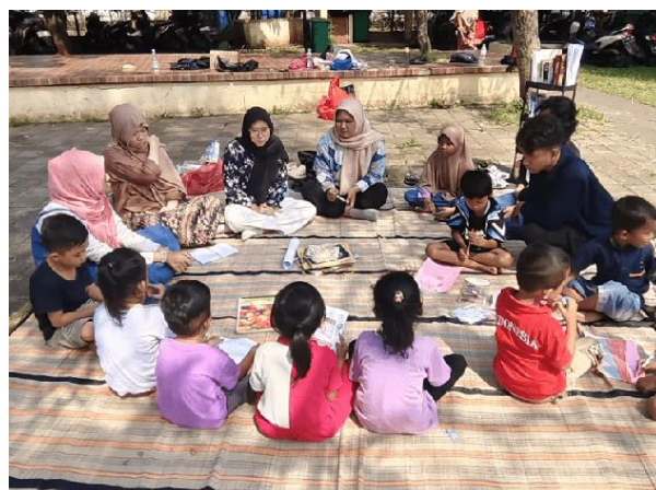
Gambar 5. Kegiatan Storytelling

Selain storytelling, kegiatan juga mencakup sesi bedah buku yang menggunakan dongeng karya Hans Christian Andersen. Pemilihan cerita dari penulis tersebut didasarkan pada pertimbangan tingkat keterbacaan dan relevansi dengan usia serta latar belakang peserta. Bedah buku dilakukan secara interaktif, di mana peserta diajak untuk membaca bersama dan mendiskusikan isi cerita secara sederhana namun bermakna. Kedua metode ini dirancang untuk saling melengkapi dalam menumbuhkan minat baca, meningkatkan pemahaman terhadap nilai moral dalam cerita, serta membangun kedekatan peserta dengan kegiatan literasi.