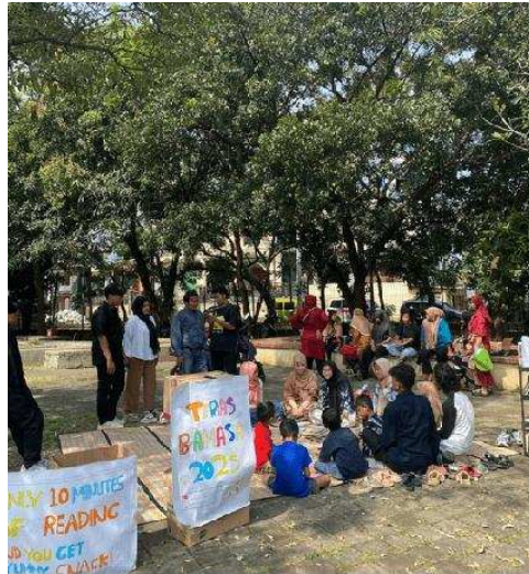
Gambar 4. Pembagian Kuesioner

Tahap keempat adalah penyusunan laporan kegiatan, yang mencakup dokumentasi proses, analisis hasil evaluasi, serta perumusan rekomendasi untuk pelaksanaan kegiatan serupa di masa yang akan datang. Laporan ini juga menjadi bagian dari pertanggungjawaban akademik tim pengabdian kepada institusi dan mitra masyarakat. Secara keseluruhan, metodologi kegiatan “Teras Bahasa” dirancang untuk memastikan kebermanfaatannya program bagi mitra, meningkatkan pengalaman belajar mahasiswa dalam kegiatan sosial, dan memperkuat peran institusi dalam pengembangan literasi masyarakat secara berkelanjutan.