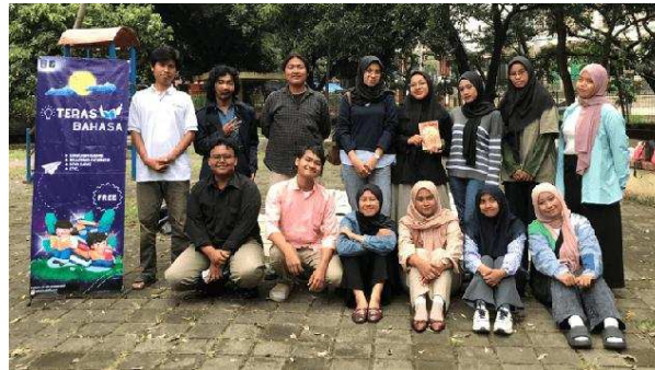
Gambar 6. Sebagian Mahasiswa/i Pelaksana Kegiatan