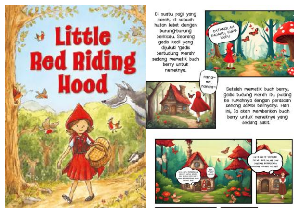
Gambar 2. Ilustrasi Buku Red Riding Hood Sumber: Goodreads