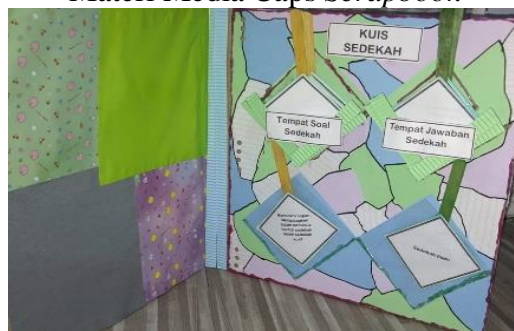
Gambar 3 Kuis Media Caps Scrapbook

Caps Scrapbook sebagai media pembelajaran visual dapat digunakan dalam proses belajar mengajar. Media ini menggambarkan informasi, konsep, dan pesan kepada peserta didik melalui gambar, foto, ilustrasi, sketsa, grafik, tabel, dan kombinasi dari berbagai bentuk visual lainnya. Representasi ini mencakup aspek realistik, simbolis, dan artistik dari suatu