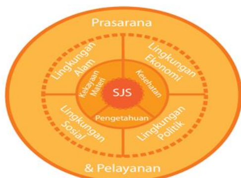
Gambar 2.1: Model Nested Spheres of Poverty (NESP)

CIFOR mengembangkan sistem pemantauan kemiskinan dengan pendekatan pembelajaran partisipatif. Setiap proses dalam sistem pemantauan kemiskinan ini merupakan hasil konsultasi dan kolaborasi yang ekstensif dengan pemerintah daerah setempat (Alborno, Becker, Cahyat, dkk. 2007). Aspek-aspek yang terdapat dalam model Nested Spheres of Poverty (NESP) dijadikan acuan untuk menyusun indikator kemiskinan.