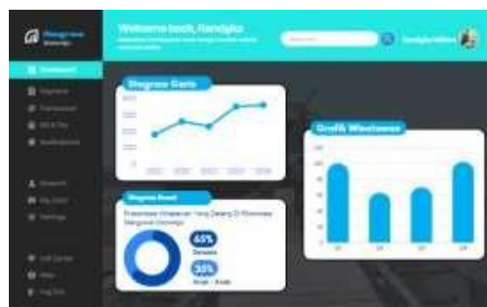
Gambar 3. Dashboard

Pada Gambar 3. Menjelaskan bahwa Dashboard ini dirancang untuk memberikan ringkasan informasi penting kepada pengguna dalam satu halaman yang mudah dipahami. Tujuannya untuk mempermudah pengelola dan pengunjung memahami statistik kunjungan dan aktivitas sistem, dan memberikan akses cepat ke fitur utama seperti pembayaran, transaksi, pengaturan akun, dan layanan lainnya.