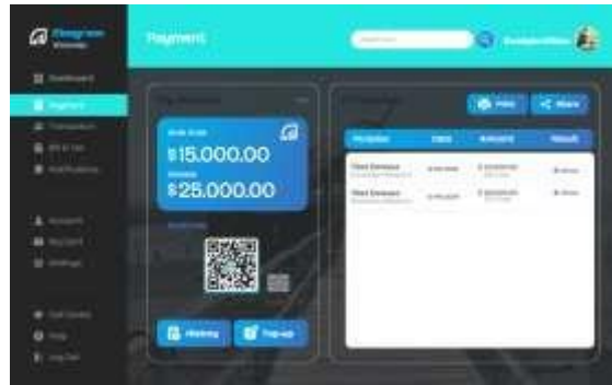
Gambar 4. Payment.

Pada Gambar 4. Terdapat pembayaran melalui gopay dengan harga anak-anak 15.000.00 dan untuk dewasa 25.000.00 dibagikan bawa harga tiket ekowisata mangrove wonorejo Surabaya terdapat link pembayaran melalui aplikasi gopay, yang terkoneksi ke system agar transaksi wisatawan bisa langsung diakses oleh user. System pembuatan seperti ini memudahkan bagi user agar data bisa dilihat dan direkap secara jelas dan detail mulaidari masuknya keuangan secara realtime. Wisataawan juga bisa cek di history transaction. tampilan antarmuka (user interface) dari sebuah aplikasi atau sistem pembayaran untuk Mangrove Wonorejo . Berikut adalah penjelasan dari elemen-elemen yang terdapat dalam tampilan tersebut: