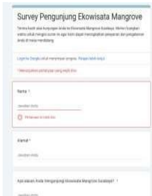
Gambar 1. Survey Terhadap Pengunjung.

Pada Gambar 1. hasil pelaksanaan penelitian survey dilakukan sebagai bagian dari analisis kebutuhan dalam mengembangkan sistem informasi dan reservasi online untuk ekowisata mangrove. Metodologi survei dilakukan kepada calon pengunjung melalui kuesioner atau wawancara.