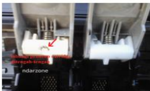
Gambar 4. Posisi pelubangan cartridge