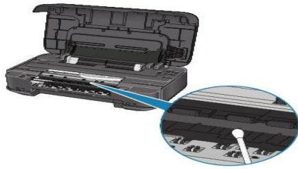
Gambar 2 Membersihkan bagian dalam printer