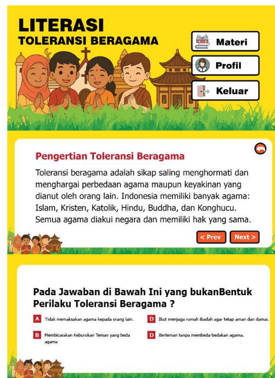
Gambar 2. Tampilan Media Pembelajaran

Berikut merupakan hasil pengembangan media pembelajaran literasi toleransi beragama berbasis Android yang telah dirancang menggunakan kombinasi perangkat desain grafis dan perangkat pengembangan aplikasi seperti yang terlihat pada gambar 2: